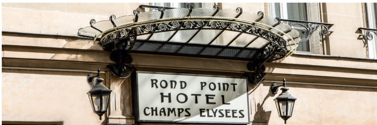
Hôtel du Rond-Point des Champs-Élysées